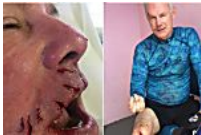
Dentista é atacado por tubarão enquanto pescava nas Bahamas