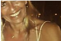
Empresária que estava desaparecida na Barra da Tijuca é localizada