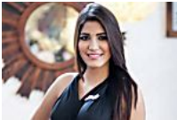
Noivo faz homenagem a Miss Mundo que morreu aos 22 anos com...