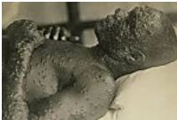
Degelo na Sibéria pode resgatar uma das doenças mais letais da História